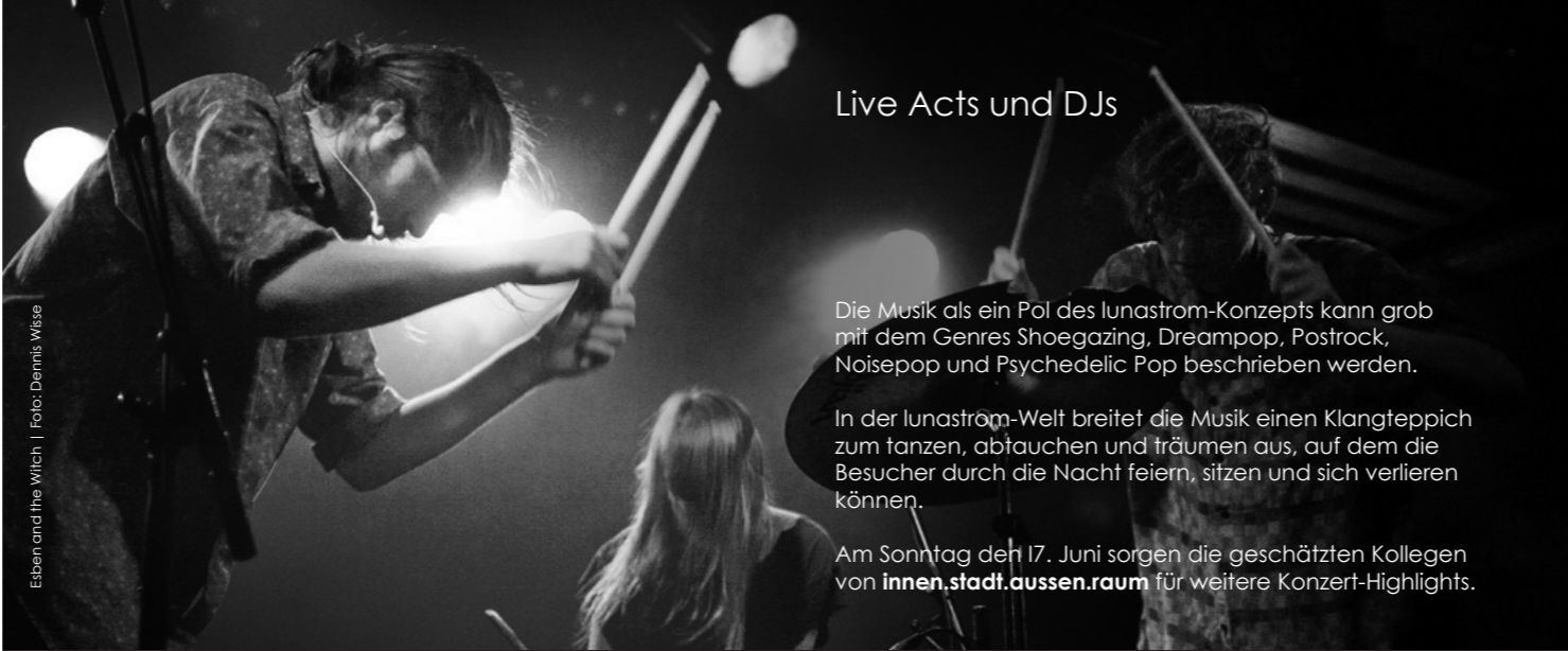
Esben and the Witch